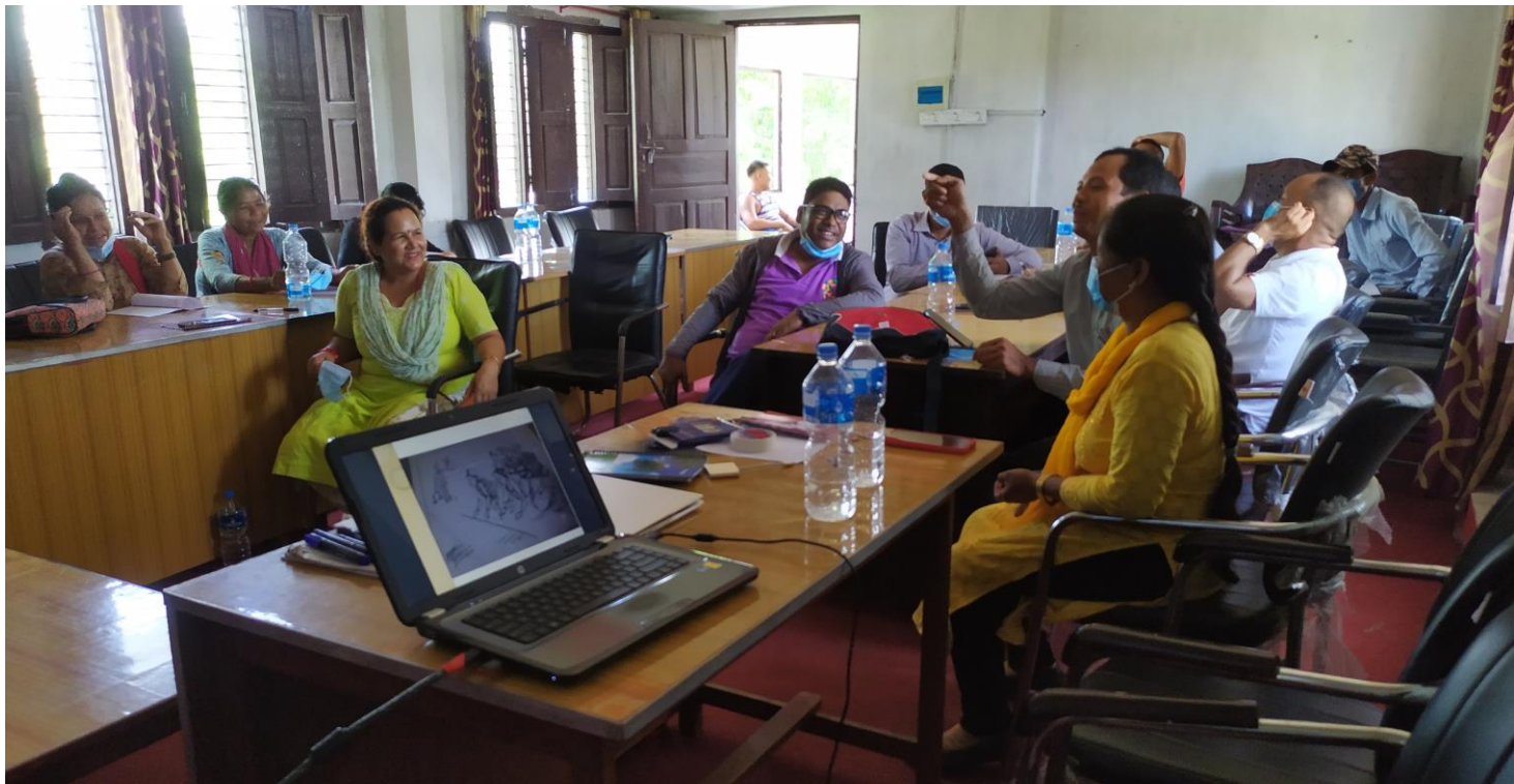
कार्यक्रमको फोटो : सहभागीहरु लैससास बारे अर्न्तकृया गर्दै