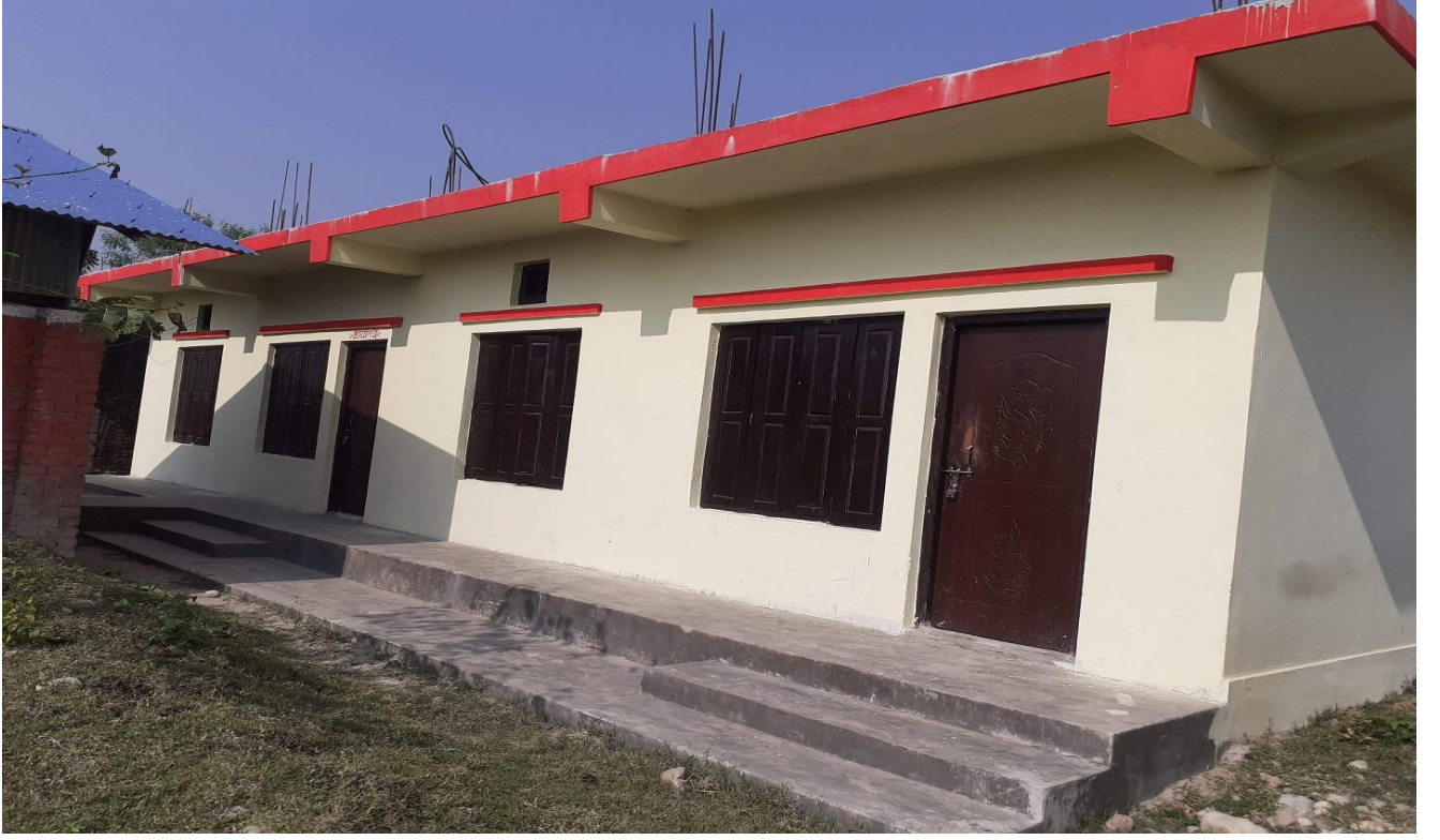
धर्म भक्त प्रावि भवन, वडा नं. ६, मनाउ (निर्माण सम्पन्न)