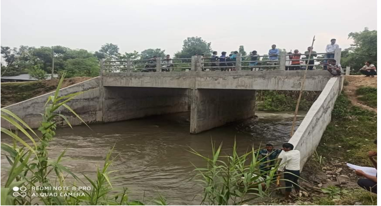
गेरूवा-राजापूर जोड्ने पक्की पुल, वडा नं. ५, चैनपूर (निर्माण सम्पन्न)