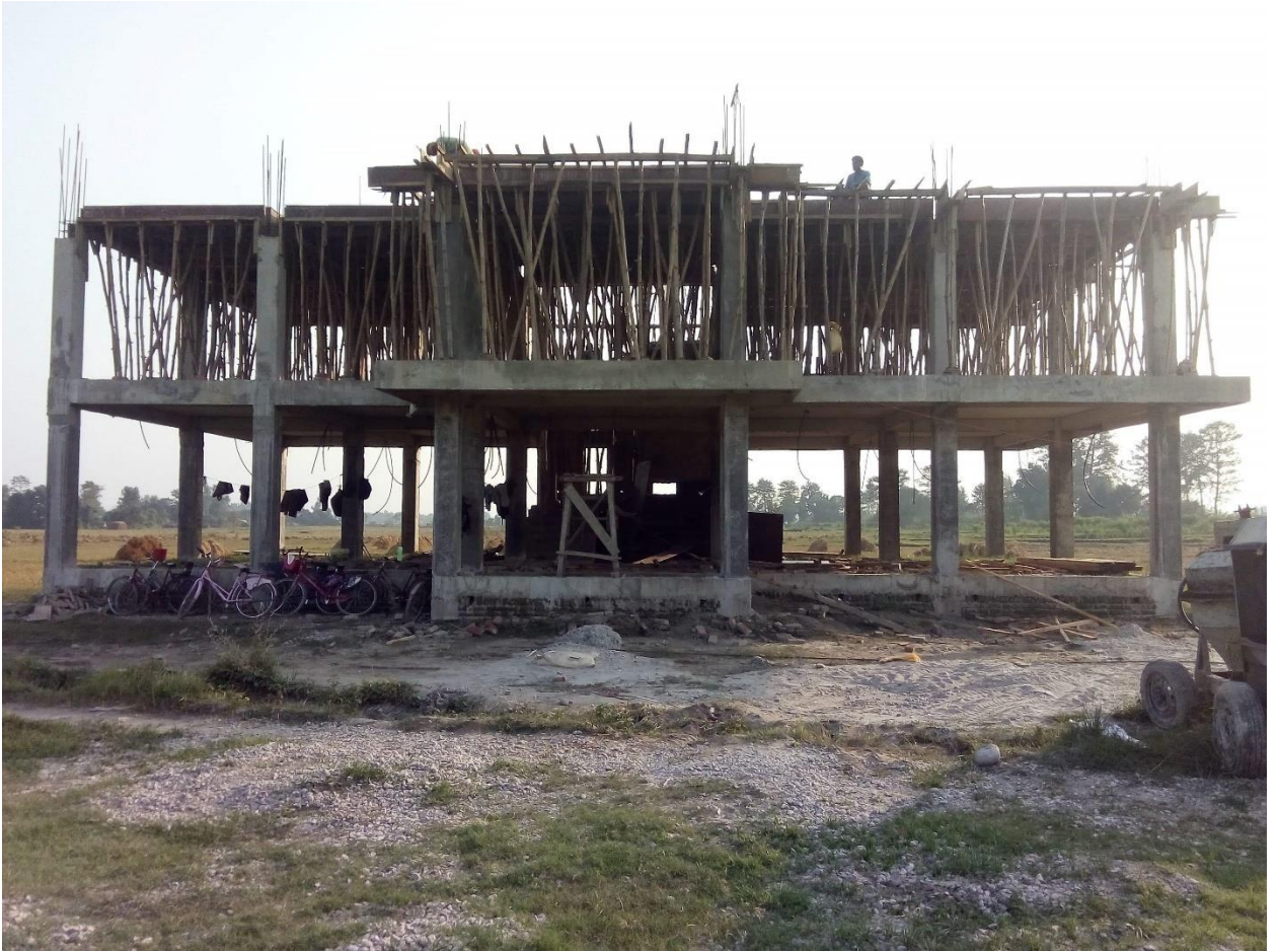
वडा नं. ४ को कार्यालय भवन, वडा नं. ४, गोला (निर्माणाधीन)