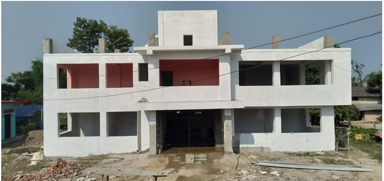
वडा नं. १ को कार्यालय भवन, वडा नं. १, बगहीपूर (निर्माणाधीन)