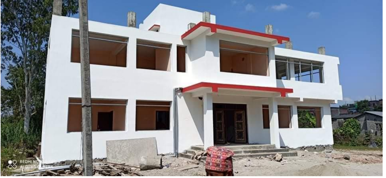
वडा नं. ३ को कार्यालय भवन, वडा नं. ३, शान्तिबजार (निर्माणाधीन)