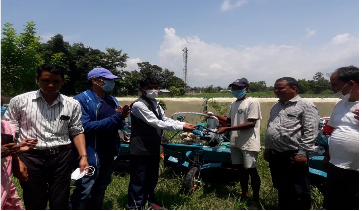
कृषक लाई यान्त्रीकरण वितरण कार्यक्रम, मुख्यमन्त्री ग्रामिण विकास कार्यक्रम