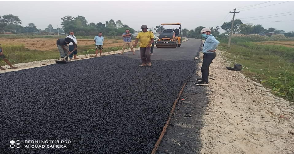
वडा नं. ६ कार्यालय जाने सडक कालोपत्रे, वडा नं. ६, मनाउ