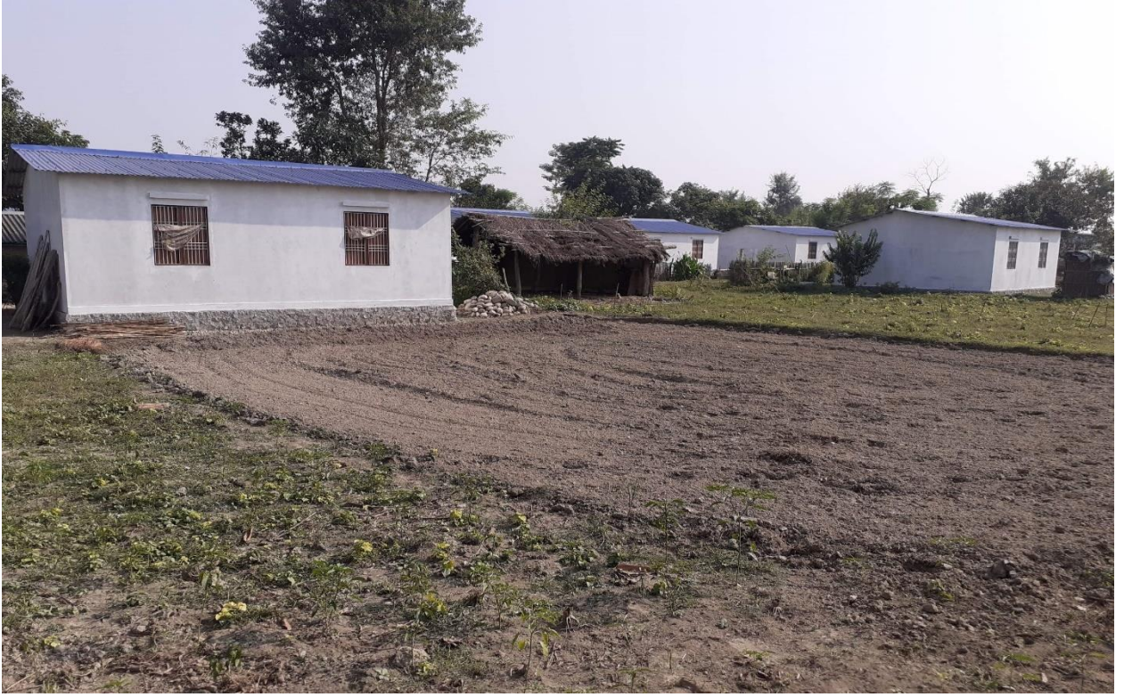
जनता आवास कार्यक्रम, वडा नं. ६, मनाउ (निर्माण सम्पन्न)