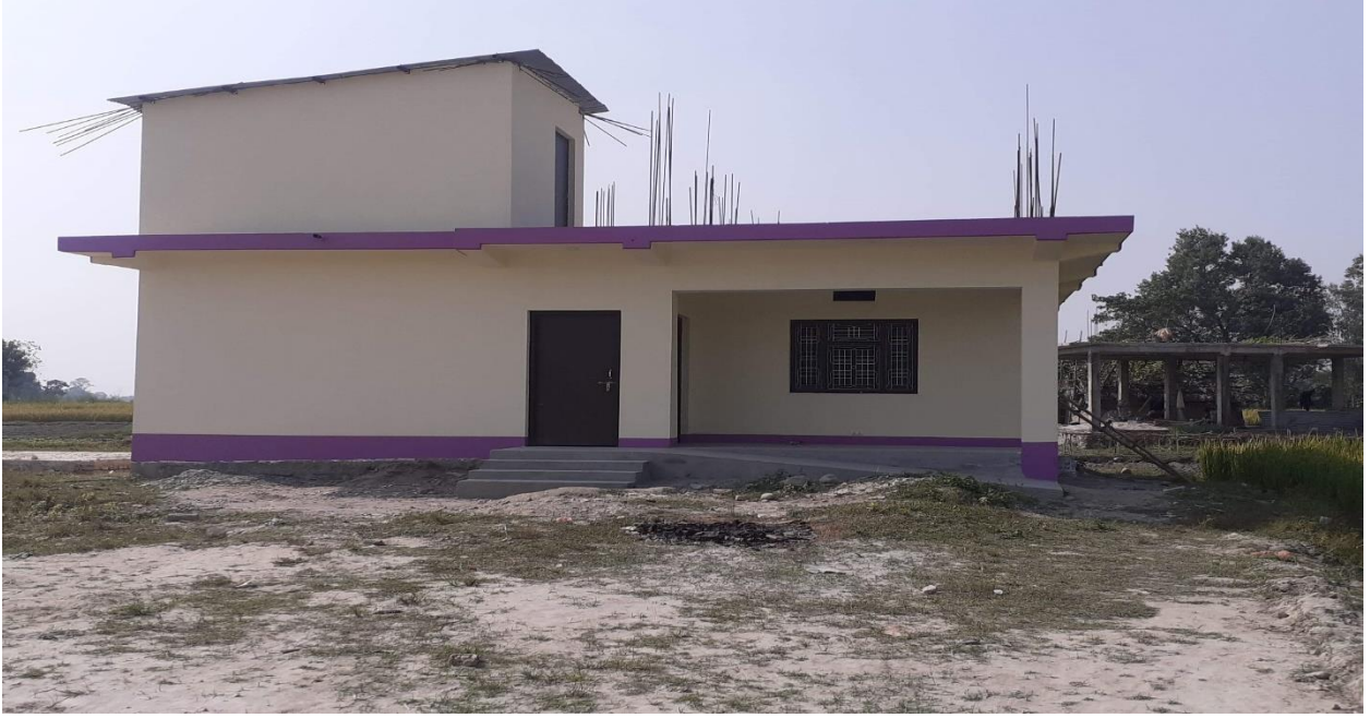
बर्थिङ सेन्टर, वडा नं. ६, मनाउ (निर्माणाधीन)