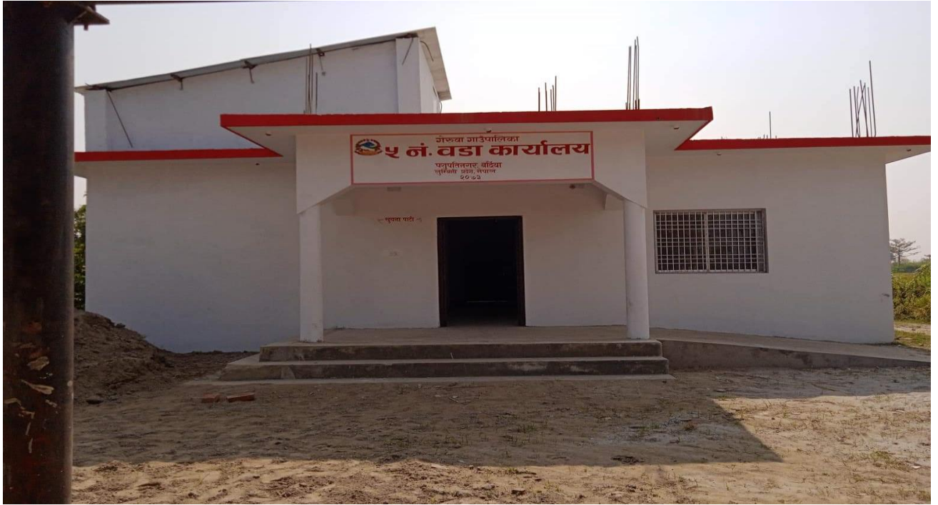
वडा नं. ५ को कार्यालय भवन, वडा नं. ५, पथरैया (निर्माणाधीन)