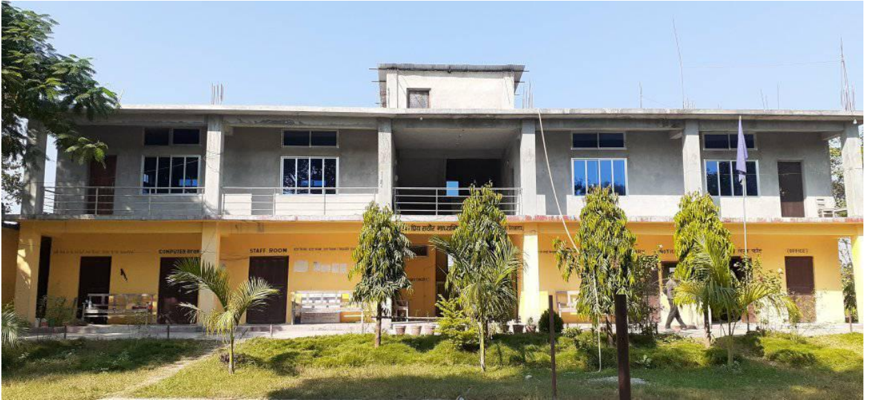
वडा नं. २ पाताभार स्थित एकप्रिय विधालयको भवन निर्माण(माथिल्लो तला)