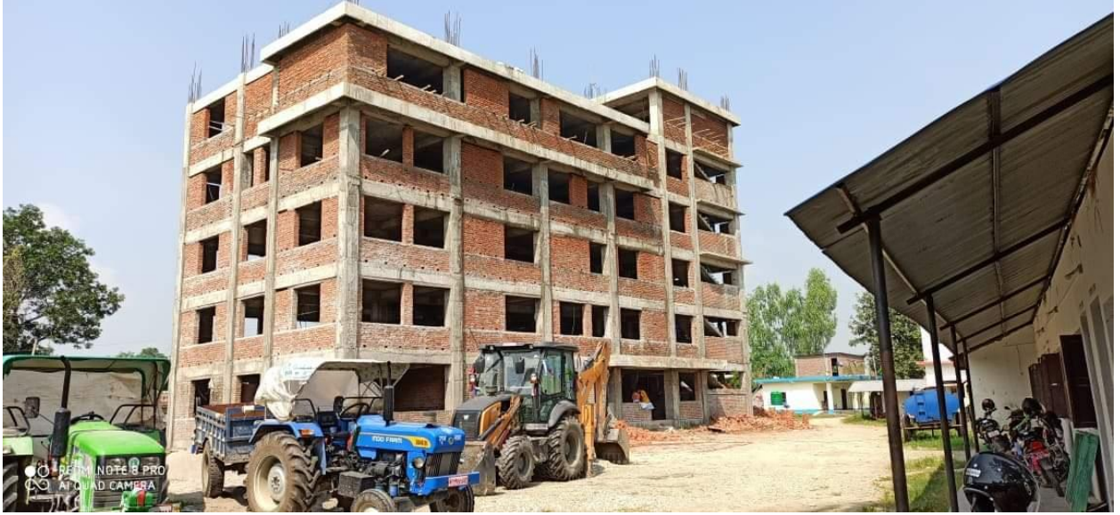
गेरूवा गाउँपालिका प्रशासकीय भवन, वडा नं. ५, पथरैया (निर्माणाधीन)