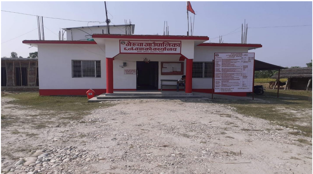
वडा नं. ६ को कार्यालय भवन, वडा नं. ६, मनाउ (निर्माण सम्पन्न)